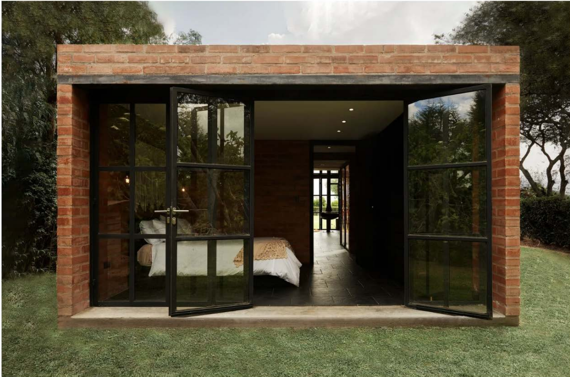
Los sistemas de aire acondicionado y calefacción no suelen utilizarse en los espacios residenciales de Ecuador, según Nandar.